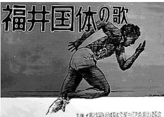
▲福井国体の歌募集ポスター 昭和40年8月23日 65003