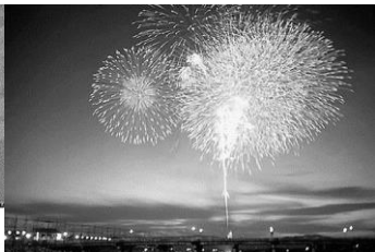
▲花火(福井市足羽河原) 昭和35年8月3日 64978